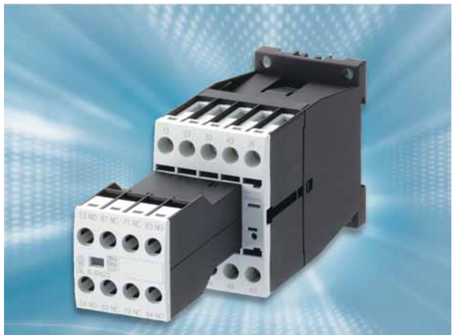
Bild 1: Das Hilfsschütz aus dem neuen Sortiment xStart von Moeller verfügt über 4 Hilfskontakte im Grundgerät. Heute ist es üblich, dass weitere Kontakte (hier 2 oder 4) im Rahmen eines Bausteinsystems, applikationsspezifisch hinzugefügt werden können.

Optimale Fertigungsverfahren sichern heute eine „verschmutzungsfreie“ Produktion der Kontakte und Schalträume. Optimierte Werkstoffpaarungen der beweglichen Teile minimieren den Abrieb über die Lebensdauer und die Kapselung schützt weitgehend gegen äußere, schädigende Einflüsse. Berücksichtigt man zusätzlich die Minimierung der Schaltgeräte-Geometrien, Leistungs-